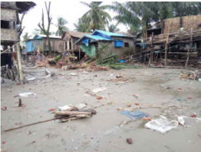
စက်တင်ဘာ ၆၊ ၂၀၁၈

မွန်ပြည်နယ်၊ ပေါင်မြို့နယ်၊ အလုပ်ကျေးရွာတွင် ပြီးခဲ့သည့် ဩဂုတ်လ (၁၂) ရက်နေ့နှင့် ၁၃ ရက်နေ့များတွင် ပင်လယ်ဒီရေမြင့်တက်မှုကြောင့် ပြိုကျခဲ့သော အိမ်များကို ယခင်နေရာ၌ ပြန်လည်ဆောက်ခွင့် မပေးသည့်အတွက် ဒေသခံ အများစုက အခက်အခဲရှိနေကြောင်း သိရသည်။