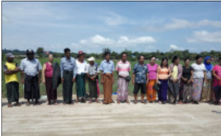
စက်တင်ဘာ ၂၈၊ ၂၀၁၈

၂၀၁၈ ခုနှစ် စက်တင်ဘာလ (၁၅) ရက်နေ့တွင် မွန်ပြည်နယ် မော်လမြိုင်မြို့ သာယာအေးရပ်ကွက်မှ ဒေသခံလယ်သမား (၂၃) ဦး ပိုင်ဆိုင်သော လယ်မြေကေ (၂၃၅) ဧကကို မော်လမြိုင်စည်ပင်သာယာရေးဌာနက ခြံခတ်ရန် ကြိုးပမ်းနေကြောင်း သိရသည်။