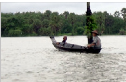
▲ စာမျက်နှာ ၃ သို့

ပြီးခဲ့သည့်ခုနှစ်အတွင်း မွန်ပြည်နယ်တွင် မိုးကြီးမှုကြောင့် နှစ်မြုပ်လျက်စီးသွားသော မိုးခေါင်စိုက်ခင်းများအား အချိန်မီ ပြန်လည်စိုက်ပျိုးနိုင်ရေးအတွက် အစိုးရက စပါးစိုက်တောင်သူများ