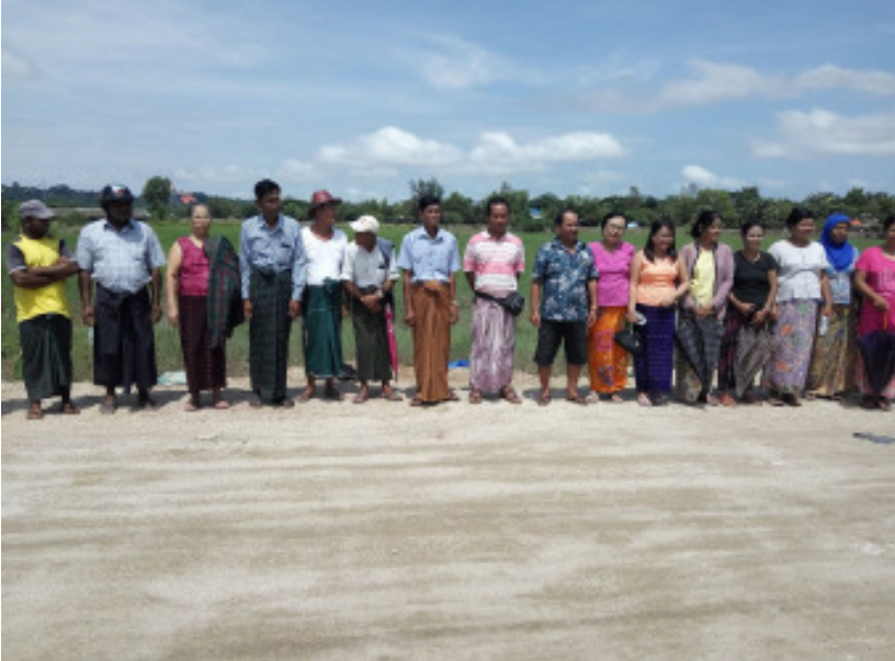
စက်တင်ဘာ ၂၈၊ ၂၀၁၈

၂၀၁၈ ခုနှစ် စက်တင်ဘာလ (၁၅) ရက်နေ့တွင် မွန်ပြည်နယ် မော်လမြိုင်မြို့ သာယာအေးရပ်ကွက်မှ ဒေသခံလယ်သမား (၂၃) ဦး ပိုင်ဆိုင်သော လယ်မြေဧက (၂၃၅) ဧကကို မော်လမြိုင်စည်ပင်သာယာရေးဌာနက ခြံခတ်ရန် ကြိုးပမ်းနေကြောင်း သိရသည်။