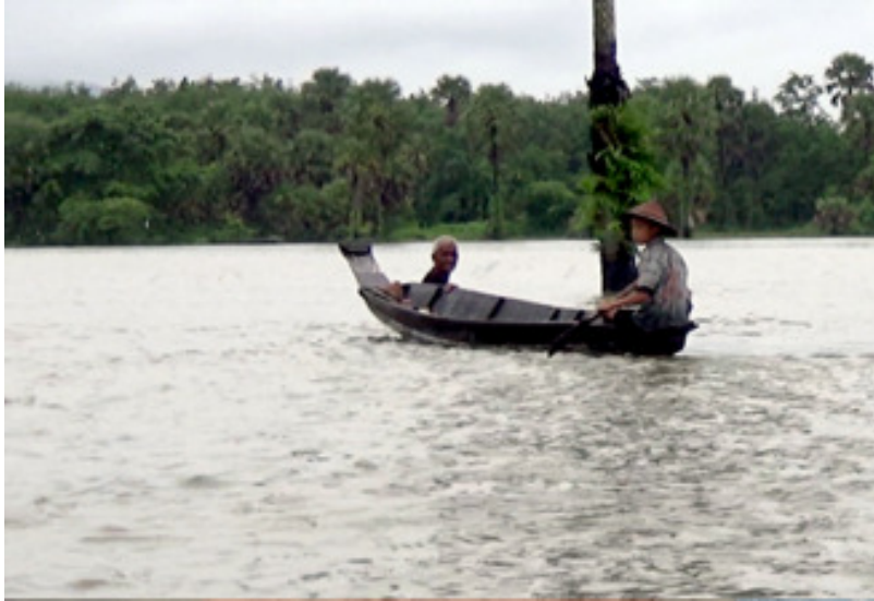
စက်တင်ဘာ ၆၊ ၂၀၁၈

ပြီးခဲ့သည့် ဇူလိုင်လအတွင်း မွန်ပြည်နယ်တွင် မိုးကြီးမှုကြောင့် နစ်မြုပ်ပျက်စီးသွားသော မိုးစပါးစိုက်ခင်းများအား အချိန်မီ ပြန်လည်စိုက်ပျိုးနိုင်ရေးအတွက် အစိုးရက စပါးစိုက်တောင်သူများအား ငွေကြေးနှင့် မျိုးစပါးများကို ထောက်ပံ့ပေးထားသော်လည်း တောင်သူများအနေဖြင့် ပြန်လည်စိုက်ပျိုးရန် အခက်အခဲဖြစ်နေကြောင်း သတင်းရရှိသည်။