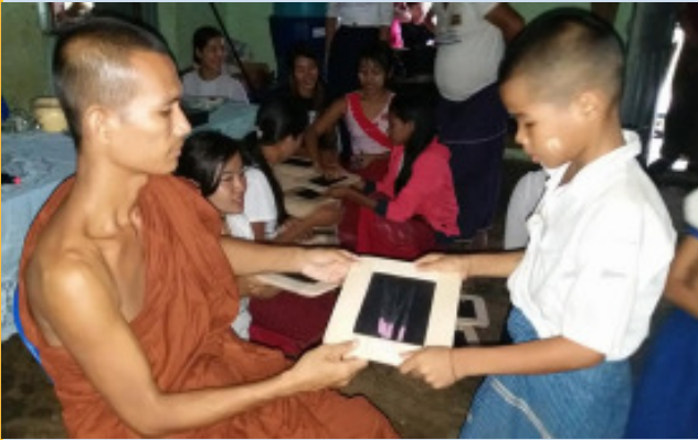
စက်တင်ဘာ ၂၅၊ ၂၀၁၈

မွန်ပြည်သစ်ပါတီအနေဖြင့် ယခုနှစ်အစောပိုင်းတွင် နိုင်ငံလုံးဆိုင်ရာ အပစ်အခတ်ရပ်စဲရေးစာချုပ် (NCA - Nationwide Ceasefire Agreement) ကို လက်မှတ်ရေးထိုးထားပြီးဖြစ်သော်လည်း မွန်အမျိုးသားအရေး လှုပ်ရှားဆောင်ရွက်မှုများကို မွန်ပြည်နယ်အစိုးရက ကန့်သတ်ချုပ်ချယ်နေဆဲဖြစ်ကြောင်း သတင်းများအရ ကြားသိရသည်။